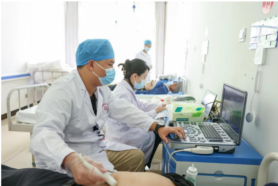
图：医生们为村民们进行各项检查