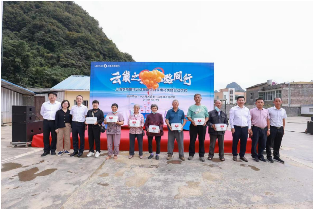
图：9月23日，上海农商银行在马关县夹寒箐镇启动2022年公益健康项目