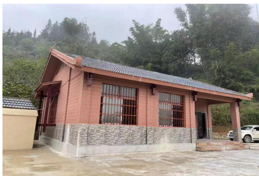
图：上海农商银行2021年援建的夹寒箐镇老寨村砖混活动室